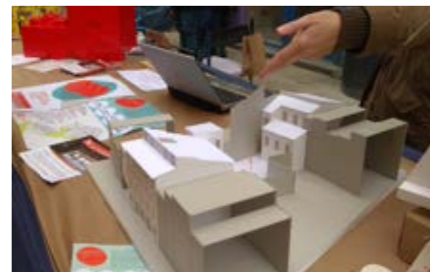
Font: La Titaranya

Maqueta de la cooperativa d'habitatges La Titaranya de Valls